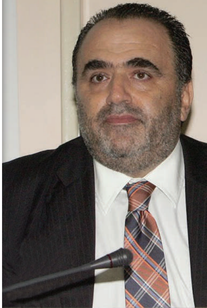
ΕΜΜΑΝΟΥΗΛ ΣΦΑΚΙΑΝΑΚΗΣ Ταξίαρχος Οικονομικής Αστυνομίας & Δίωξης Ηλεκτρονικού Εγκλήματος